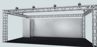
Stand tipo: 32m 2